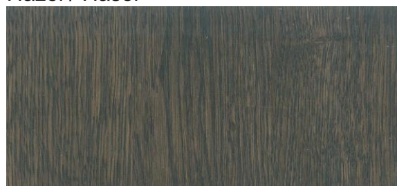
Ebony / Ebenholz