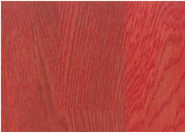
Red / Rot