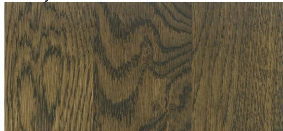
Hazel / Hasel