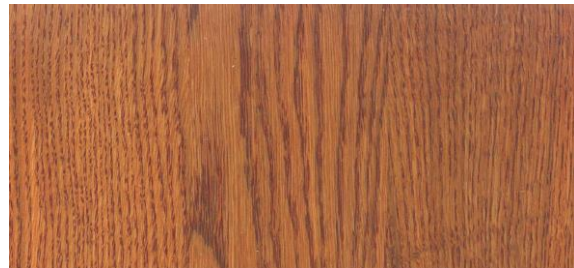
Cherry / Kirsche