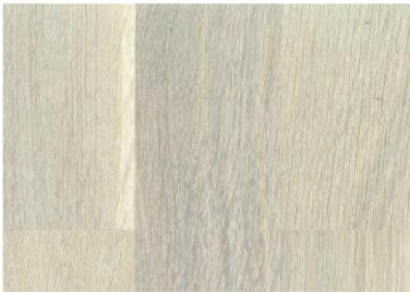
White / Weiß