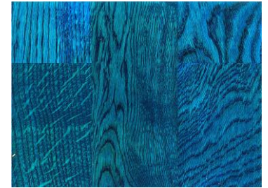
Blue / Blau

Die wiedergegebenen Farben wurden auf dem Standardholz Eiche erzeugt und dienen aufgrund der Drucktechnik nur der Orientierung. Der endgültige Farbton ist vom Holz und der Arbeitstechnik abhängig.