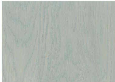
Light Grey / Lichtgrau