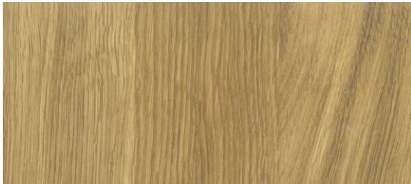
euku oil 1FS Farblos