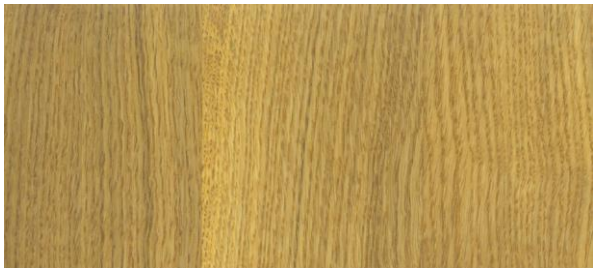
Pine / Pinie