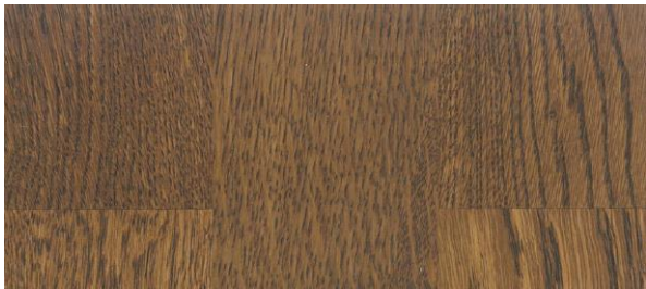
Coffee / Kaffee