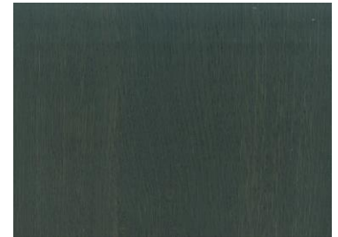
Black / Schwarz