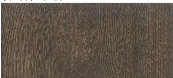
Mahogany / Mahagoni